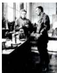
O casal Curie