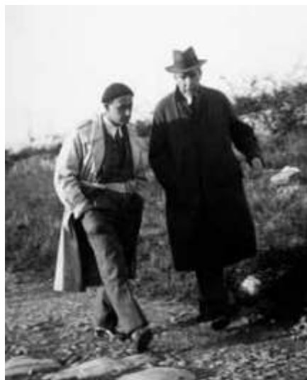
Enrico Fermi e Niels Bohr