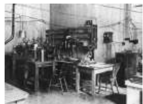
Laboratório de Rutherford

Resultados dos desvios das trajetórias, as partículas alfa permitiram o estabelecimento do seu modelo nuclear, que é análogo ao nosso sistema planetário. O núcleo central é positivo, e em torno dele gravitam partículas negativas: os elétrons.