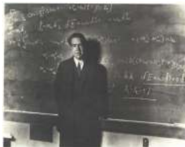
Niels Bohr, estudou o problema da estabilidade do átomo.

*Quantum produto da constante de Planck pela frequência da radiação. A ideia original da teoria de quantum é de Max Planck (1901) e foi utilizada no estudo da radiação do corpo negro.