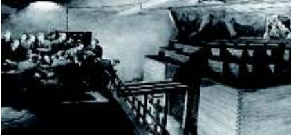
1º Reator Nuclear**

Universidade de Colúmbia para Universidade de Chicago, onde era professor. Formou uma grande organização, concentrada em Chicago, que tomou o nome de