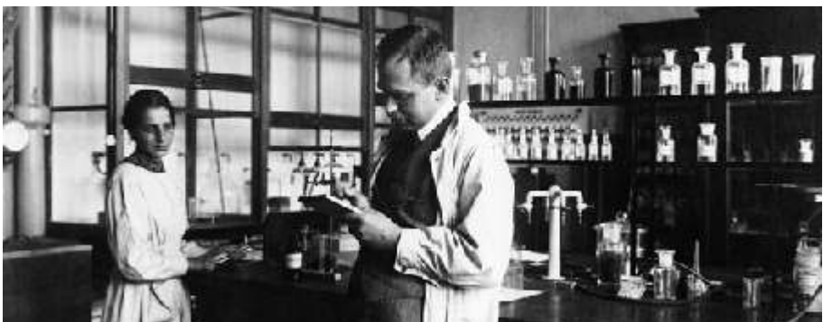
Lise Meitner e Otto Hahn